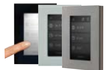
Externes Touch Display