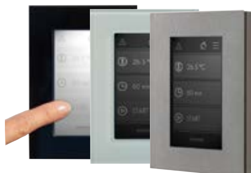
Écran tactile externe en trois versions

Le cadre est fixé sur l'écran grâce à des aimants ce qui permet aisément d'adapter la couleur du cadre choisi.